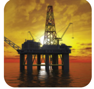
الغاز و البترول