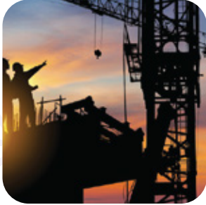
البنية التحتية والإنشاءات